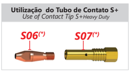
(*) Linha de Opcionais/Optional Line