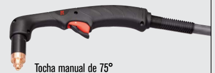
Tocha manual de 75°

(para mais opções de tochas, visite www.hypertherm.com )