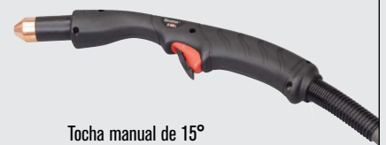
Tocha manual de 15°