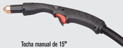
Tocha manual de 15°