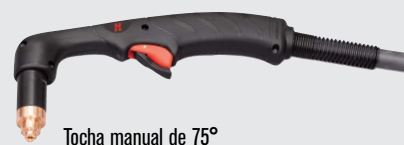
Tocha manual de 75°

(para mais opções de tochas, visite www.hypertherm.com )