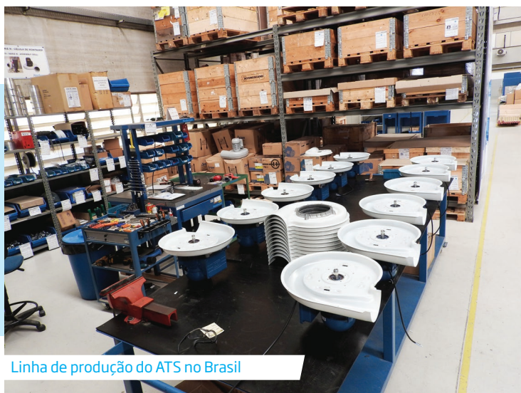
Linha de produção do ATS no Brasil

Presente no Brasil desde 1996, conta com profissionais altamente qualificados, produção local de diversos produtos da linha, estoque local de produtos acabados e peças de reposição, e equipe própria de assistência técnica.