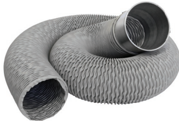
Mangueiras diam. 150mm superflexíveis e antichamas