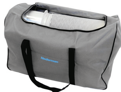
Bolsa para transporte das mangueiras