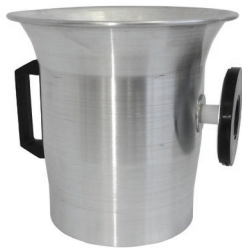
Bocal metálico com magneto